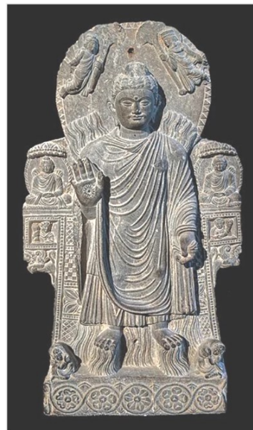
Fig. 4. Buddha and the Śrāvastī miracle, Paitava, Afghanistan, ca. 300 CE