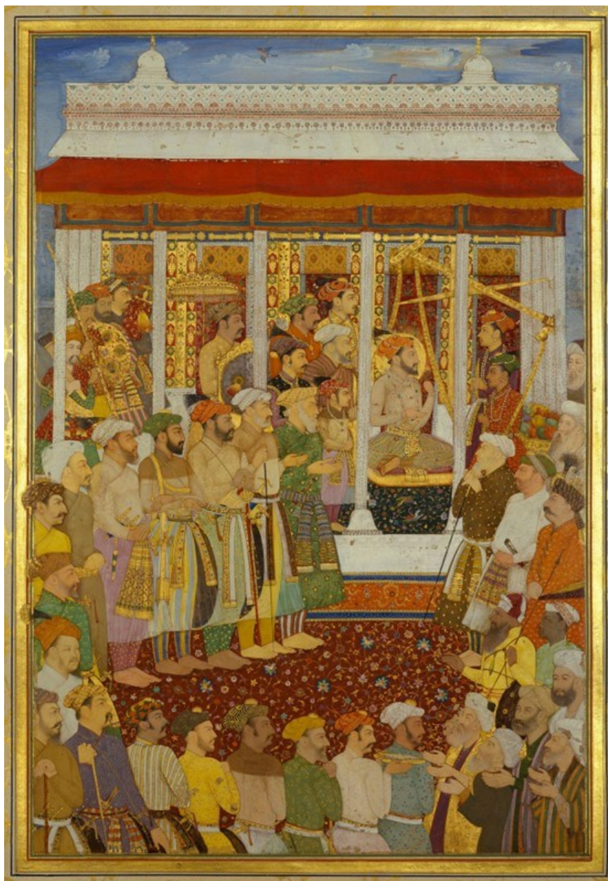
Fig. 2. The Weighing of Shāh-Jahān on his 42nd lunar birthday, 23 October 1632. Painted by Bhola in c. 1640.