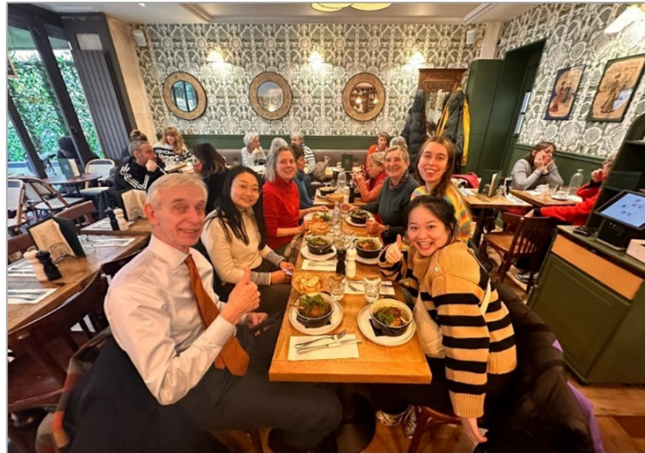
Fig. 2. Break and lunch.

Masterpieces of the region were being prepared for display. Among these was a gilded lintel, once part of a Tibetan stūpa , that showed the damage incurred during the Cultural Revolution. Next, we were fortunate to go to the museum's storage rooms to witness the unpacking of recent acquisitions, such as images of Avalokiteśvara, Bhairava and others that will be part of the new exhibition. Unique thangkas are also carefully preserved in the storage area. There is an urgent need for additional storage space, according to Mr. Zéphir.