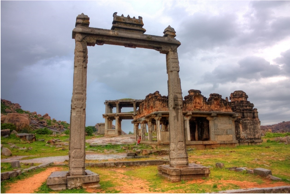
Fig. 1. The King's Balance at Hampi

The influence of the tulāpuruṣadāna in history is not only limited to the Hindu community. Buddhist rulers in 11th–12th century Sri Lanka, as well as later Mughal emperors and princes, also performed this ritual in their own contexts. (fig. 2) Relevant records are found in epigraphs and historical works such as the Cūlavamsa and the Padshahnama .