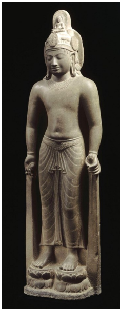
Fig. 3. Bodhisattva Avalokiteśvara South Vietnam, ca. 800 CE