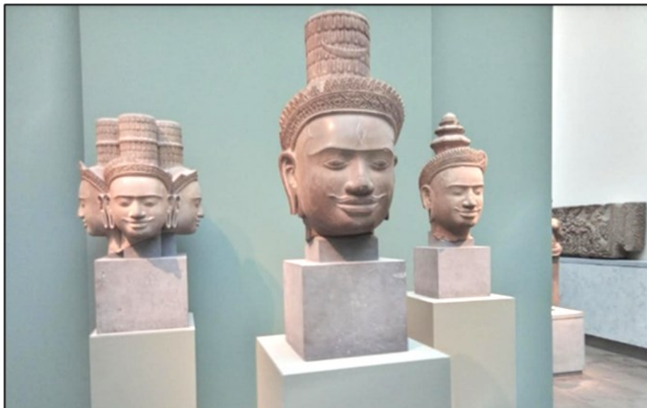
Fig. 1. Brahmā, Śiva and Viṣṇu, Khmer style, 9th-10th cent.

Back to 2024. After the introduction, we were shown several Khmer statues from Cambodia on the ground floor of the museum, such as the impressive sculpture of the gods, the demons and the mythic snake, from the Hindu narrative of ‘The Churning of the Milk Ocean’, originally from the Buddhist Bayon temple in Cambodia. It now greets the visitors at the beginning of the exhibition. Khmer style images of the Hindu gods Brahmā, Śiva and Viṣṇu, stemming from Seem Reap (in northeast Cambodia) and commissioned between the 9th and 10th century by the ruling elite, illustrate uniquely Khmer art features in their headdresses, moustaches, tiaras, and extended eyebrows (fig. 1).